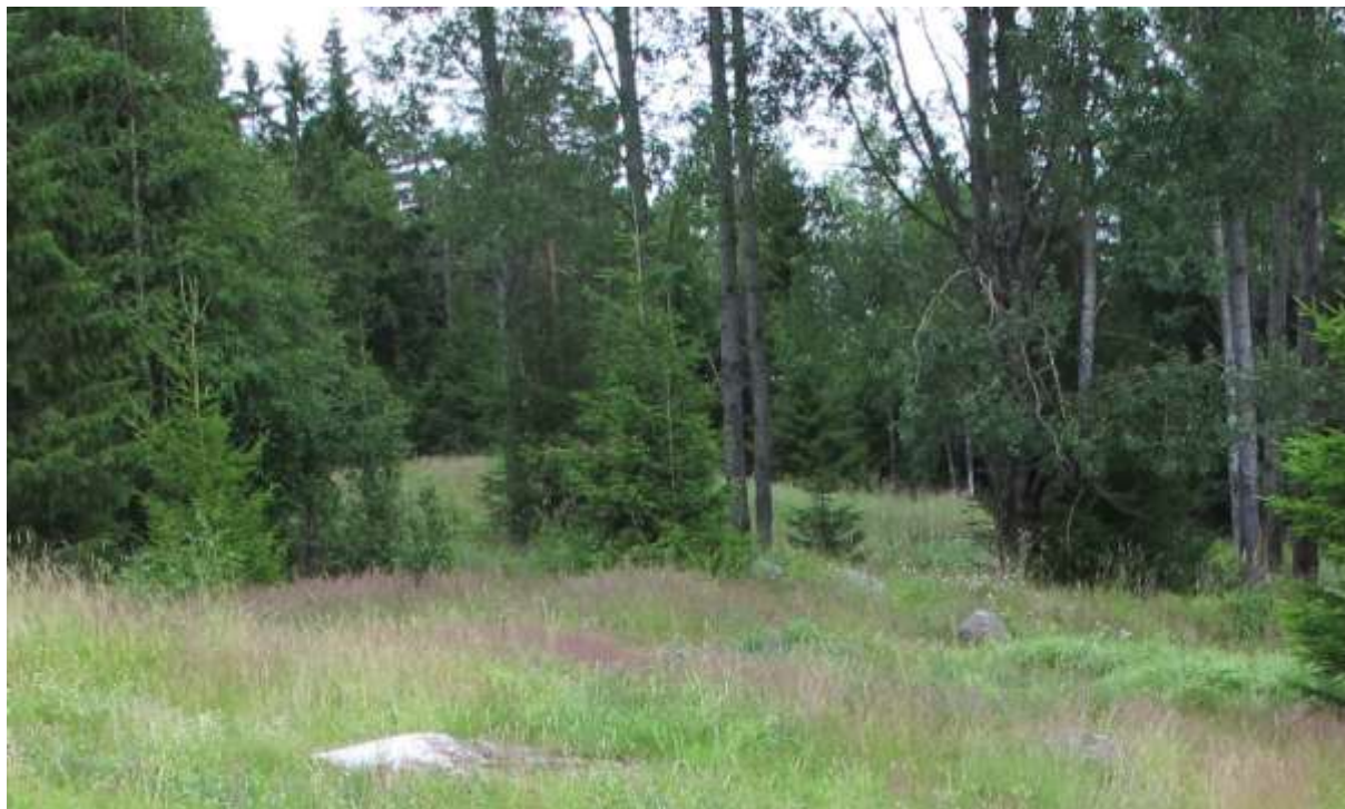
Figur 6. Lokaltetens østlige del sees bak ospetrærne i bildet. I dette området vil en anbefale at det slås to ganger per sesong, i alle fall de første årene, for å se hvordan en art som snerprørkvein responderer på dette. Eventuell forekomst av arter som gulaks, blåklokker og prestekrager settes igjen ved første slått.