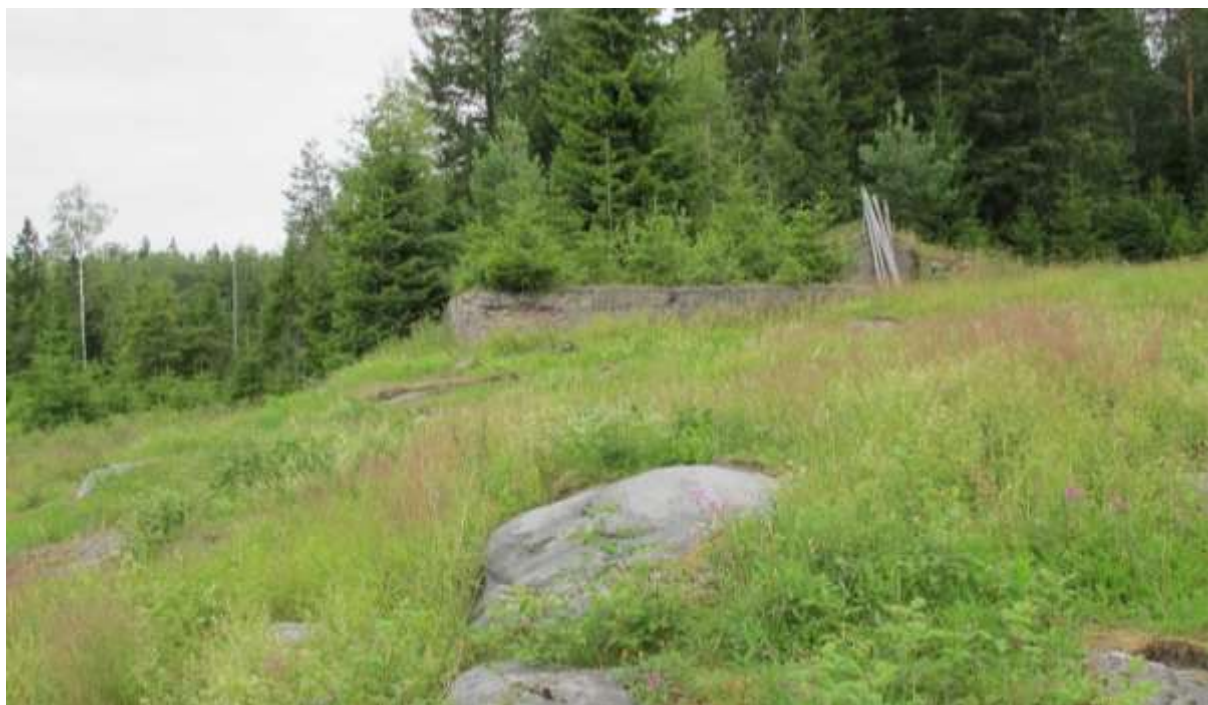
Figur 7. Den østligste delen av lokaliteten. Her ser en også murene etter det gamle fjøset som stod her, med låvebrua til høyre i bildet. Legg merke til alle de store steinene innenfor lokaliteten. For presist å kunne slå her, er det trolig både enklest og mest effektivt at slått utføres med ljà.