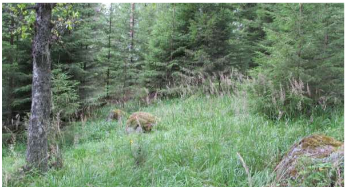
Figur 5. Nord i lokaliteten er det plantet en del gran. Denne bør fjernes med tanke på gjenopptagelse av slåtten. At alle trærne ikke fjernes samtidig, er viktig for å unngå for stor gjødselvirkning fra de råtnende røttene.