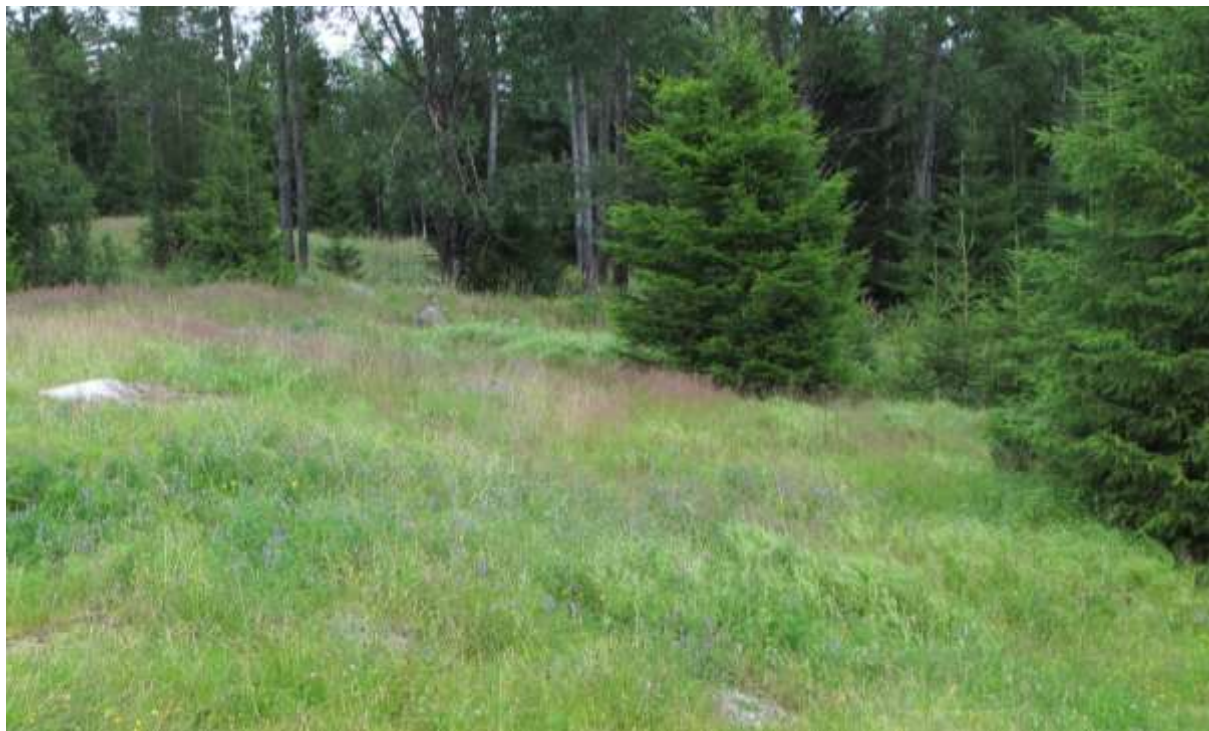
Figur 4. Sentrale deler av lokaliteten sett fra vest mot øst. Her ser en mye av de unge granene som bør fjernes, samt ospeholdet som bør fjernes.