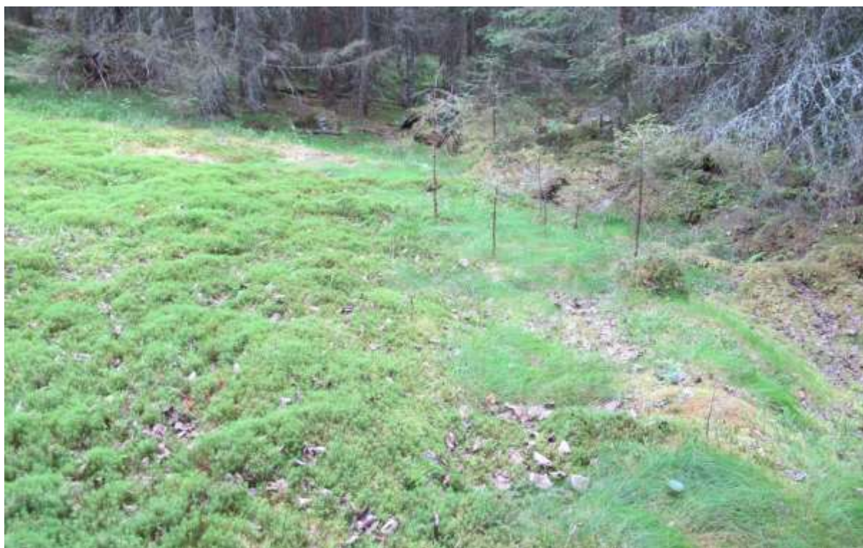
Figur 5. Helt i sør er det et svært tydelig skille mellom skogen og de engene som fremdeles er åpne. Her finnes en del storbjørnemose i et belte langs kanten. Under grana til høyre i bildet skimtes ei rydningsrøys.