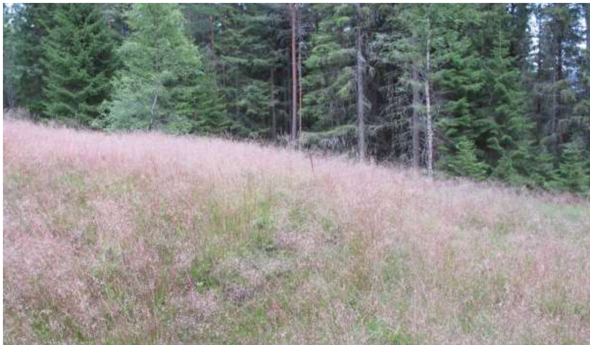
Figur 4. Sentrale deler av lokaliteten består av mye smyle og sølvbunke. Legg merke til hvor tett skogen står langs kantene.