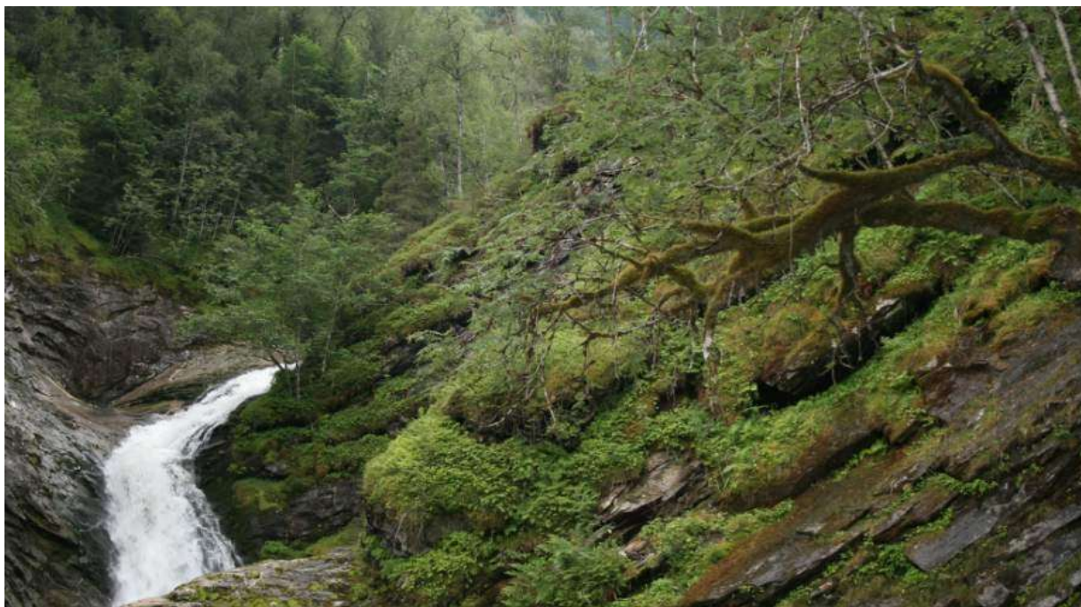
Figur 3. Moserikt parti av Sagelvi omlags midtveges oppe i lia. Som ein ser, så er det mykje mose både på bakken og på den halvdaude rogn som utover på høgre sida. Det er mest berre ryemose som veks på rogn, medan mattehutre er den dominerande arten på bakken.

Ein ser ingen grunn til presentera nokon moseliste for denne elva, då det berre vart observert trivialitetar her og knapt nok nokon art som kan knytast til elva fordi arten er særskild fuktkevjangande.