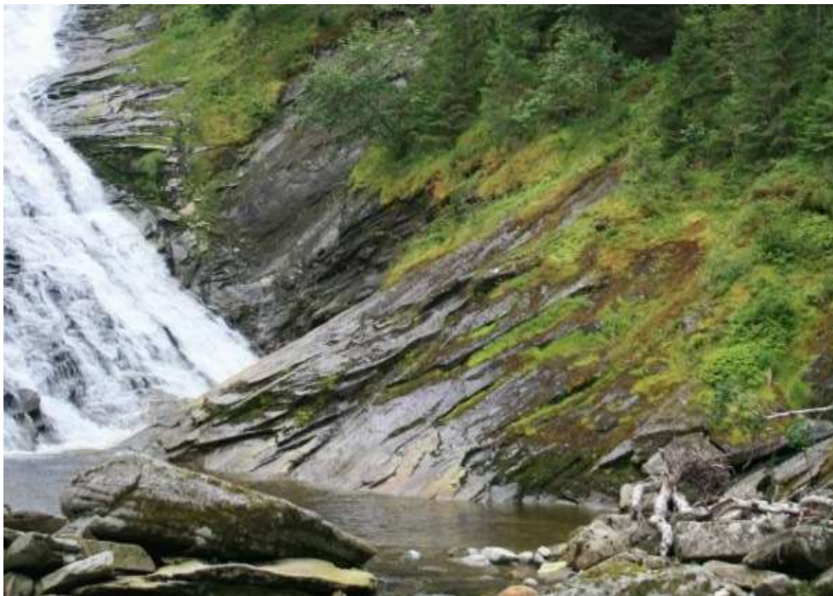
Figur 2. Biletet viser miljøet ved den største fossen i Sagelvi. Det er nok litt mose her, men vanlege artar som mattehutre, stripefoldmose og liknande artar dominerer fullstendig.

Forstyrta miljø (vegar, grøfter og liknande) bør ikkje såast til med framandt plantemateriale.